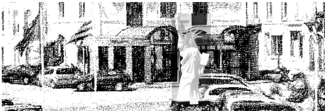
Une réplique de la Statue de la Liberté a été offerte à Bretagne TransAmérique en 1990 par Air France, pour remercier les nombreux émigrants ayant fait le voyage outre-Atlantique avec le bureau d'Air France installé à Roudoualec jusqu'en 1985.

Aujourd'hui, on avance le chiffre de 6000 à 7000 Bretons du Centre Bretagne installés aux États-Unis.